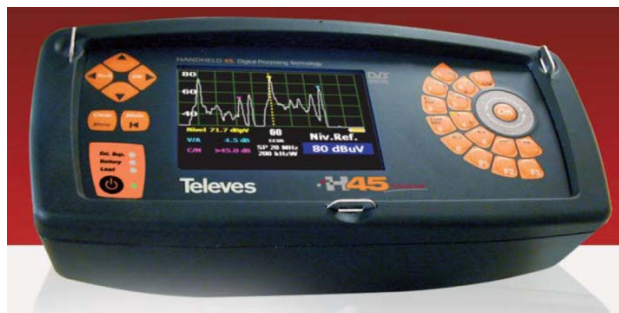
Medidor de campo portátil H45